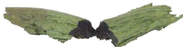
Powlekany mulch produkowany ze zużytych opon

Nawierzchnie z Mulch EPDM łatwiej utrzymać w czystości. Zapewniają one także stały poziom bezpieczeństwa. Luźne i niezwiązane kawałki kory lub trocin są podatne na szkodliwe działanie czynników zewnętrznych, mogą gnić, przemieszczają się i wymagają znacznie więcej pielęgnacji.