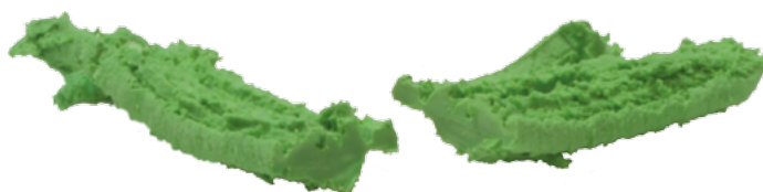
Mulch EPDM z pierwotnych surowców, zabarwiony w 100%